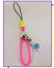
ファスナーストラップ